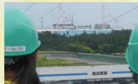
2025年8月 福島第一原発を臨む福島スタディーツアー