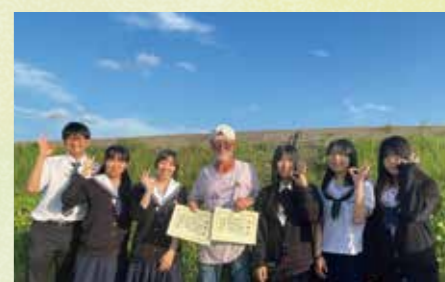
2025年5月 感謝状贈呈 碧南・咲かそうひまわりの会